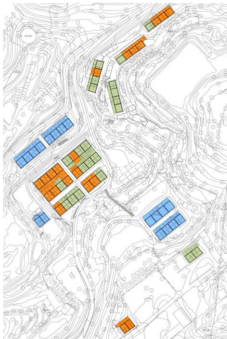
INTERVENCIÓ COLÒNIA ARQUERS

Els habitatges en ús presenten condicions adequades. Molts dels habitatges sense ús es troben en mal estat.