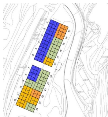
INTERVENCIÓ COLÒNIA MANUELA

En el cas de la colònia Manuela, dels 8 habitatges en ús, 6 estan en bon estat o presenten patologies lleus.